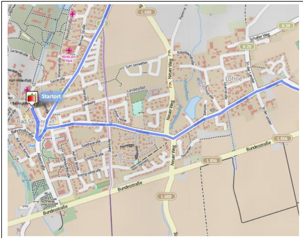
Bad Sassendorf Detailkarte Hin- bzw. Rückweg durch den Ort

Die Permanente RTF „Durch die Soester Börde“ ist im Breitensportkalender des BDR ausgeschrieben und findet entsprechend der „Generalausschreibung Radtourenfahrten“ des BDR statt.